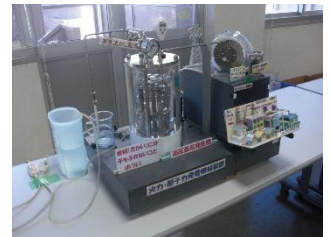
原子力発電模型実験

1. 「いろいろな発電方法」では、発電方法とその特徴について学習した。火力発電・原子力発電・水力発電・太陽光発電・風力発電・燃料電池等 地球温暖化の原因とされている二酸化炭素との関係や先進国の中で発電資源の自給率が、日本は11.8%で大変低いことも学習し、今後の日本の技術の開発で外国に頼らない発電が必要なことも学習した。