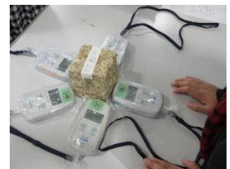
「はかるくん」でみかげ石の放射線を測定