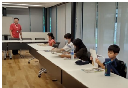
東海村が発展した歴史の話を聞きました