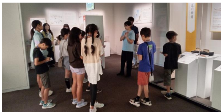
スタッフのかたの説明を聞いて熱心にメモをとります