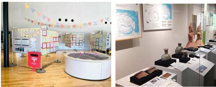
古代の東海村の様子がわかる展示コーナー