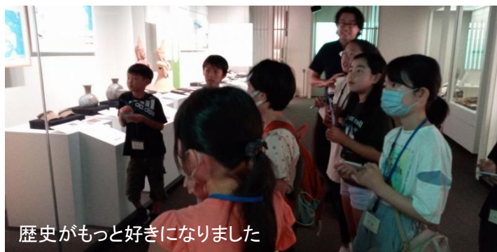
歴史がもっと好きになりました

東海村には約80基の古墳が確認されており、茨城県で唯一、東海村の古墳にしかない埴輪があるそうです。 縄文時代には大きなムラもあり、人・モノ・文化の交流があったことがわかるそうです。