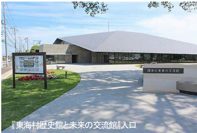
『東海村歴史館と未来の交流館』入口