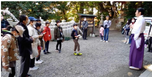
朝日宮司さんから、大甕神社の神々のお話と神話の時代からの伝説や歴史をお聞きました。

案内を担当して下さい 方に、団員一人一人が質 問をしました。収録もし ていて緊張します。