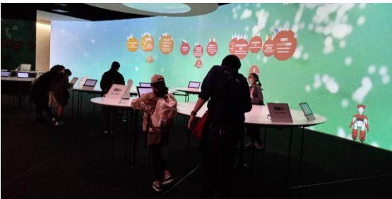
日立発展の歴史がやさしく学べます