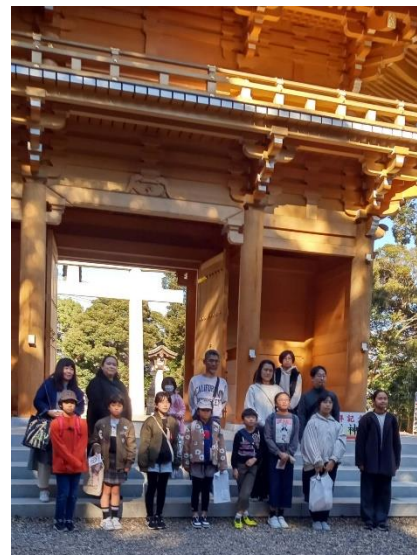
大甕神社境内への入り口の『神門』

宿魂石上にある大甕神社本殿へは、険しい参道を登って行きます。みんな心を込めてお参りをしました。