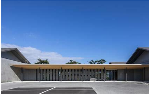
『日立オリジンパーク』正面入り口